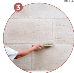
3 Je brosse et j'hydrofuge

Calepinage = Façon de disposer les éléments de parement pour obtenir un ensemble harmonieux.