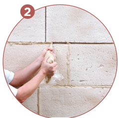
2 Je réalise les joints