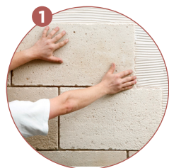
1 Je pose en croisant les joints d'une rangée sur l'autre