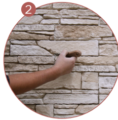
J'élimine le surplus de colle