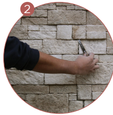
J'élimine le surplus de colle