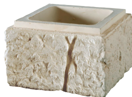
Élément boisseau droit et gauche BRIDOIRE L. 35 x l. 35 x H. 20 cm