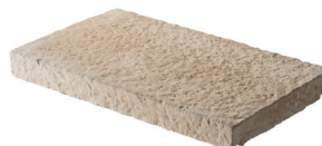
Chapeau de mur BRIDOIRE L. 40 x l. 24 x H. 5 cm L. 50 x l. 30 x H. 5 cm