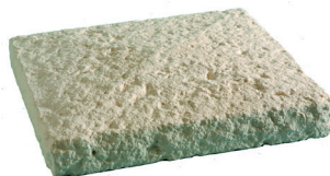
Chapeau de pilier BRIDOIRE L. 42 x l. 42 x H. 7 cm