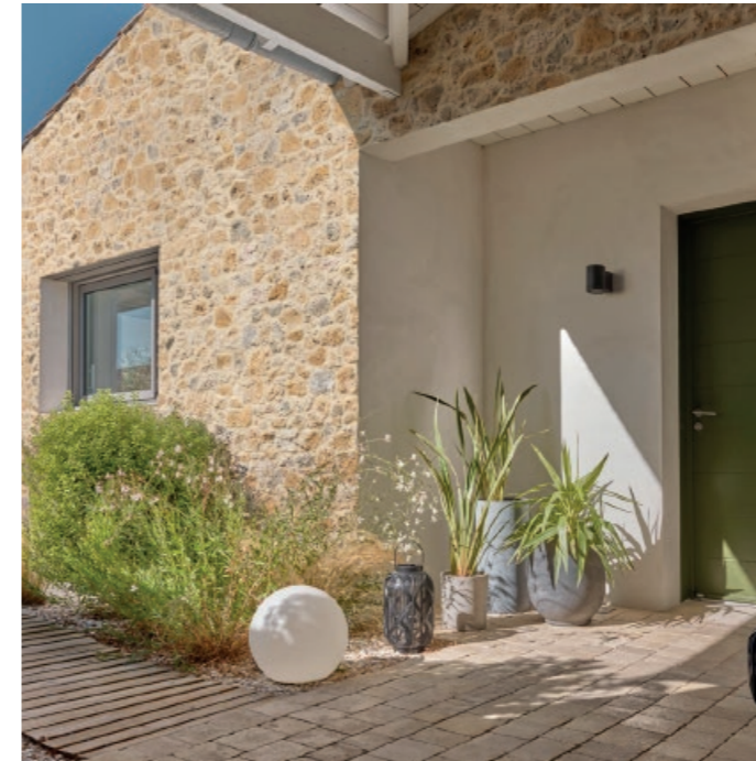
Parement MEULIERE ton ocre jaune