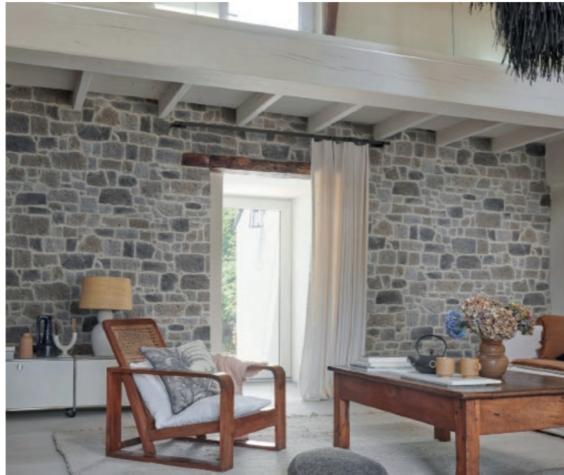
Parement MANOIR ton gris cendré