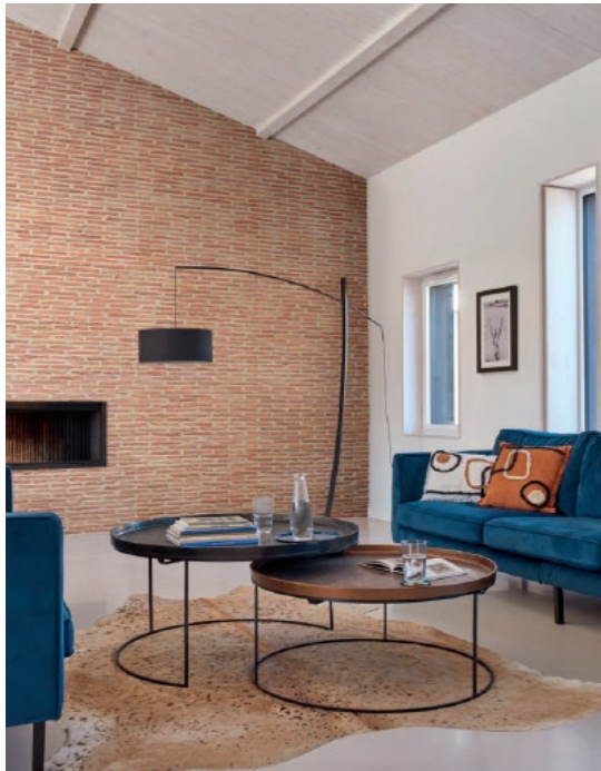
Parement BRIQUETTE ton rouge

Une fois de plus, ORSOL nous charme avec des univers différents mais tous reliés par l'envie d'un habitat chaleureux, accueillant et esthétique.