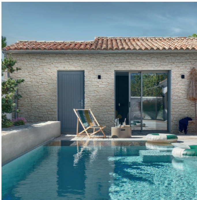
Parement CAUSSE ton pierre