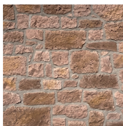
MANOIR ton rouge rosé

Le parement BRIQUE est désormais proposé en ton naturel : cette teinte lumineuse aux nuances subtiles apporte une touche cosy et réconfortante à nos intérieurs.