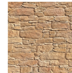
Ton beige doré