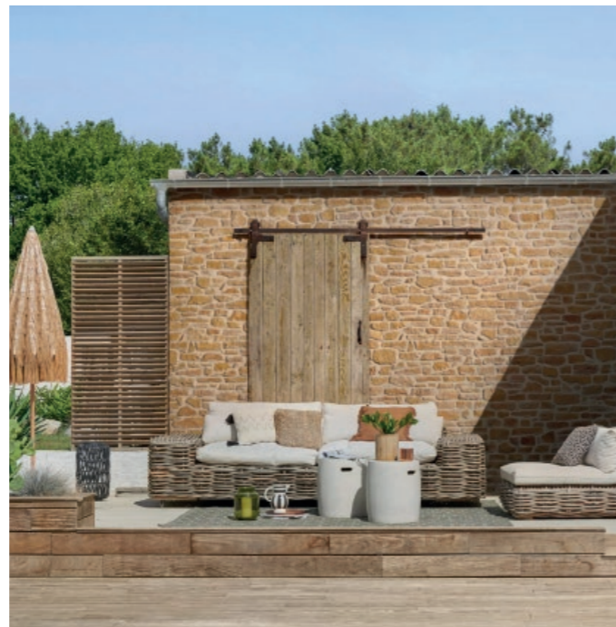
Parement CAUSSE ton beige doré