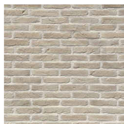
BRIQUE ton naturel

Pour cette saison, ORSOL complète ses gammes déjà existantes avec des nouvelles teintes pour ses parements MANOIR et BRIQUE ainsi que les piliers PORTLAND et BRIQUE conçus pour l'aménagement paysager d'une entrée ou d'une allée. Tour d'horizon d'innovations inspirantes sous le signe d'un habitat élégant et contemporain.