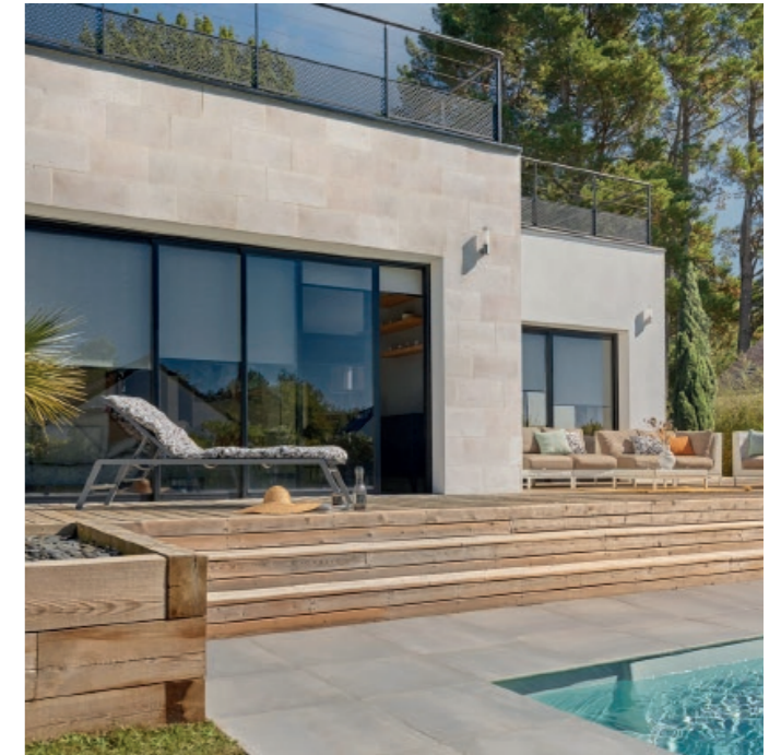
Parement BRECZY ton naturel