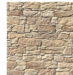
Ton beige nuancé