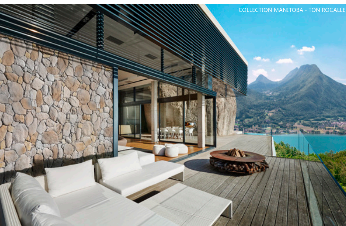
COLLECTION MANITOBA - TON ROCALLE

La pierre et la mer incarnent une naturalité absolue