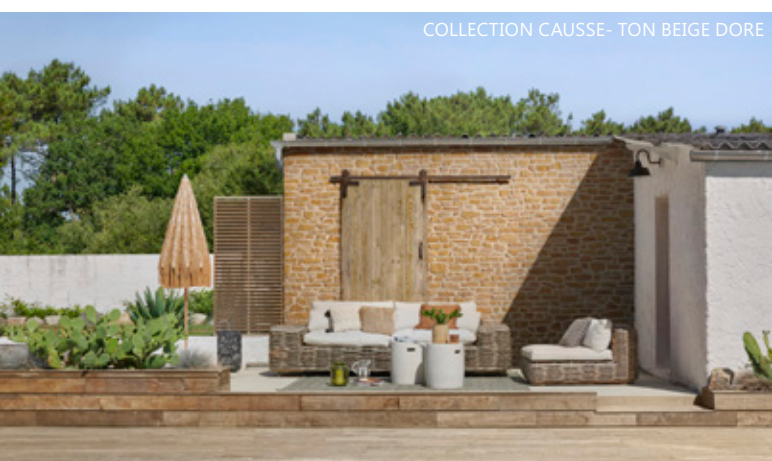
COLLECTION CAUSSE - TON BEIGE DORE