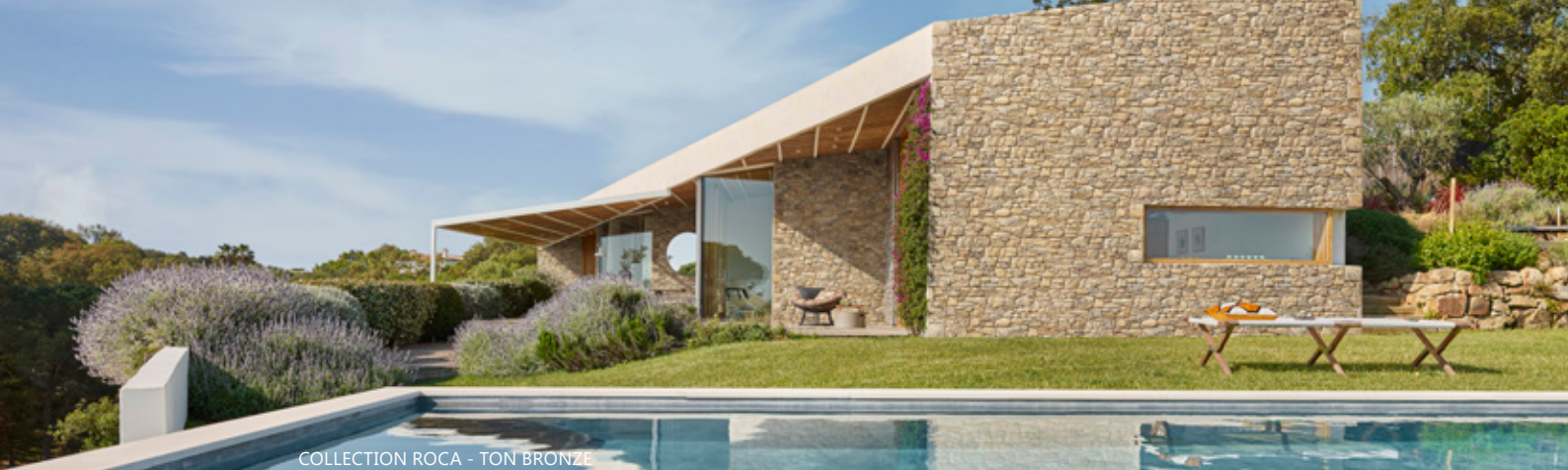
COLLECTION ROCA - TON BRONZE