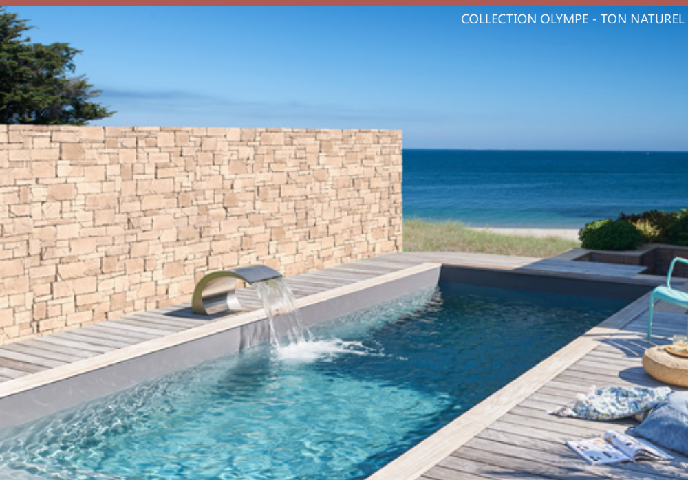
COLLECTION OLYMPE - TON NATUREL

Les parements sont les artisans de l'ambiance parfaite, quelle que soit la fonction des espaces extérieurs qu'ils revêtent.