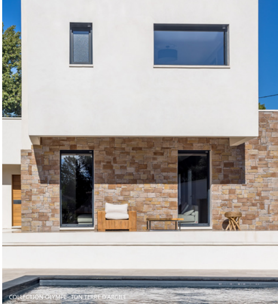
COLLECTION OLYMPE - TON TERRE D'ARGILE

Les textures rugueuses et la teinte naturelle des pierres captent les rayons du soleil pour diffuser une chaleur réconfortante tout au long de la journée. La terrasse devient alors un refuge intime où l'on se sent protégé et en harmonie avec la nature environnante, invitant à la détente et à la contemplation des instants précieux de la vie.