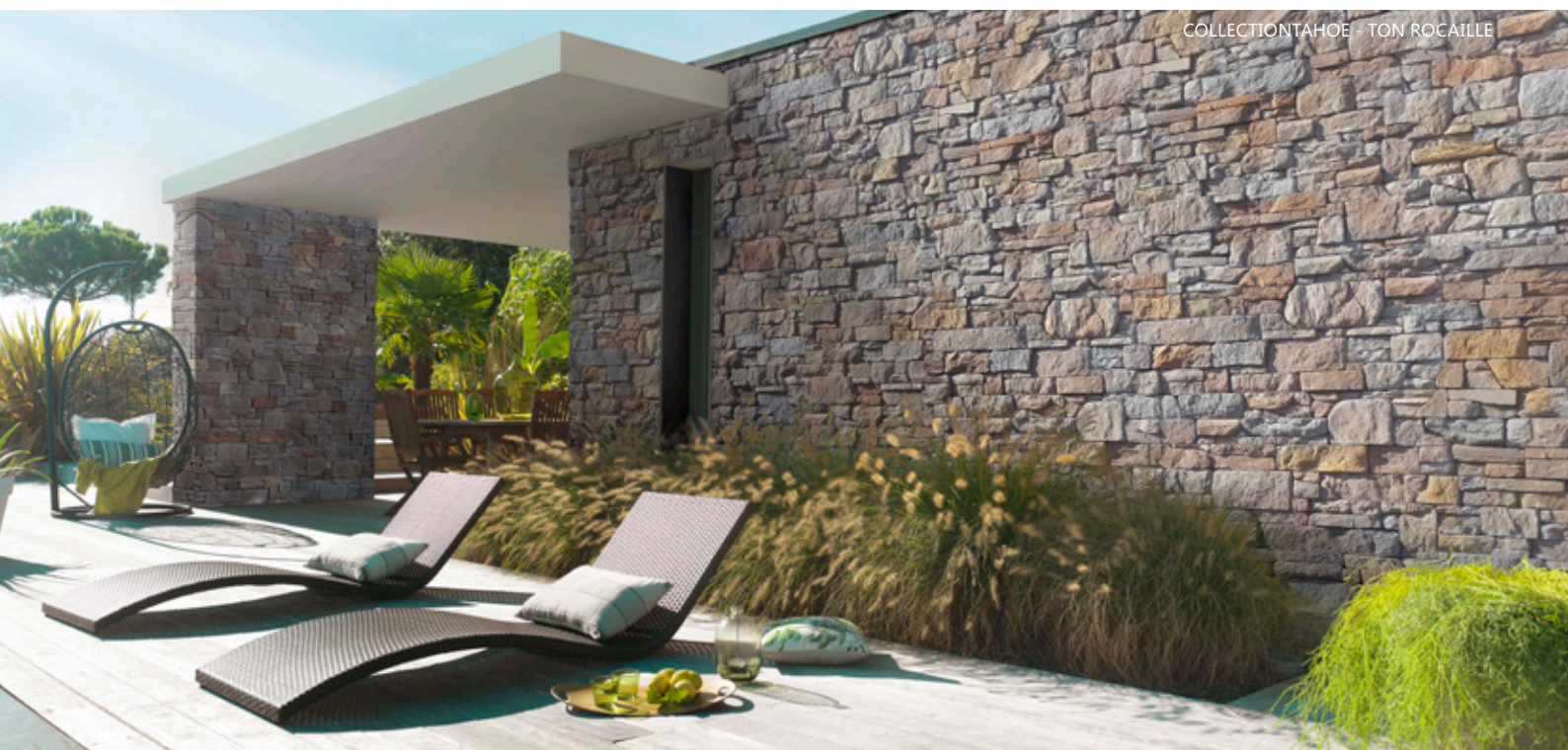
COLLECTIONTAHOE - TON ROCAILLE