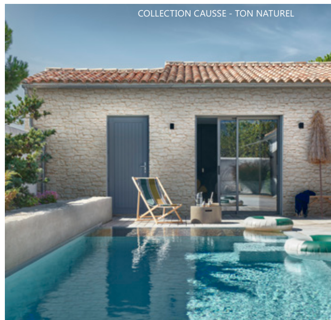
COLLECTION CAUSSE - TON NATUREL